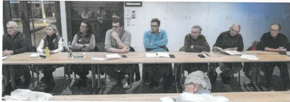
Le dernier conseil de l'année a été très studieux.

Mercredi 11 décembre avait lieu le dernier conseil municipal de l'année. Plusieurs délibérations étaient au programme.