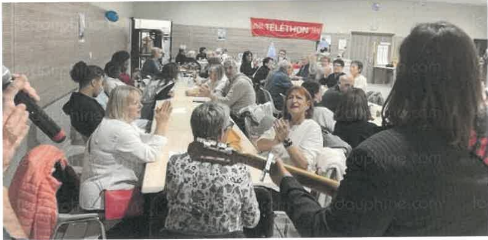
Le karaoké était attendu et a fait des heureux.

La journée Téléthon organisée par la commune samedi 30 novembre a été un plein succès, le public ayant répondu présent. Le matin, 85 personnes ont participé à la marche, alors que les pâtisseries, brioches, pains, gâteaux et les petits objets de Noël vendus à la salle de la Rencontre ont rapidement trouvé preneurs.