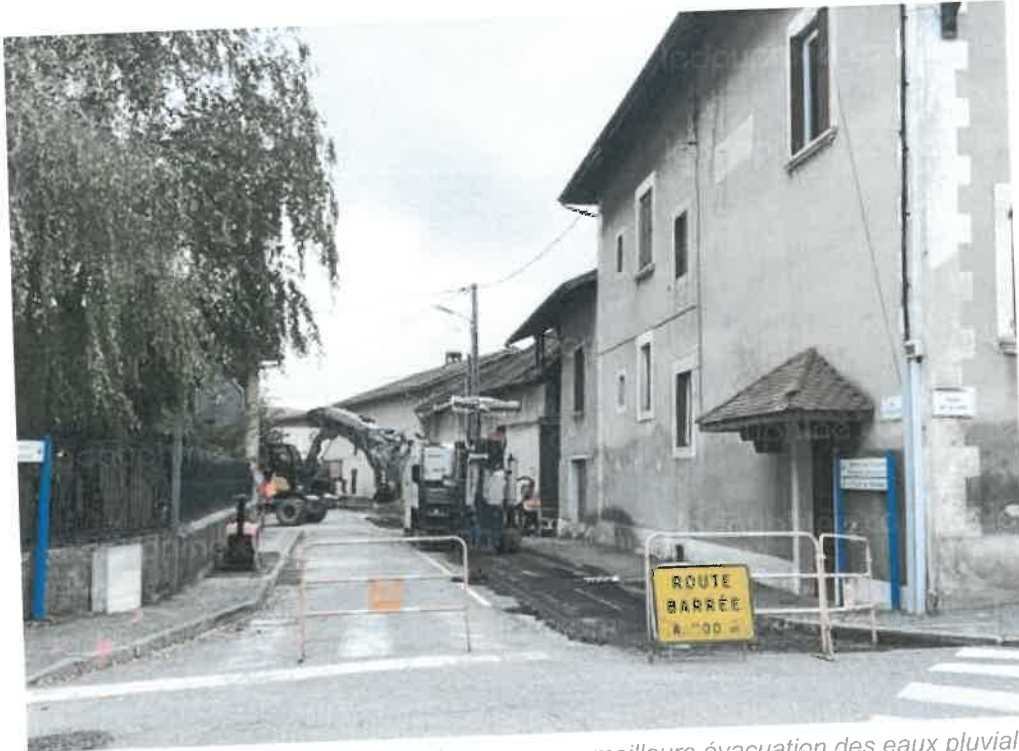
Des travaux importants mais nécessaires pour une meilleure évacuation des eaux pluviales.

La commune poursuit ses travaux de voirie avec l'entretien régulier des chemins communaux. C'est le cas actuellement au quartier Champ-Canel, avec des travaux quelque peu bruyants mais nécessaires.