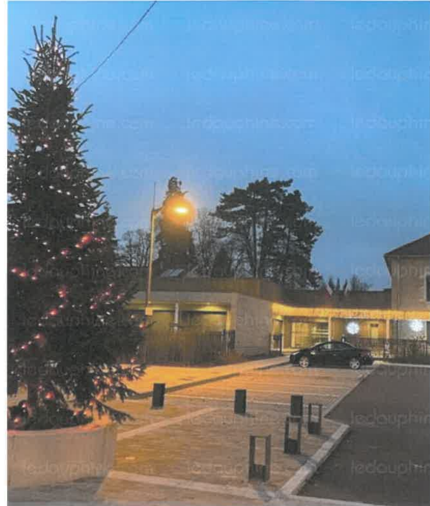
La féerie de Noël sur la place du village.

Depuis quelques semaines, le village a revêtu sa parure de fête avec ses guirlandes lumineuses, toutes à LED. Cette année, petite nouveauté avec l'illumination de la nouvelle mairie, grâce à une guirlande de devanture dorée scintillante et quelques cristaux de neige. Sur la place trône un joli sapin, sobre mais élégant, avec ses guirlandes mordorées. Chaque année, le village rajoute un peu de décorations lumineuses., comme aux entrées du village et sur les bâtiments communaux.