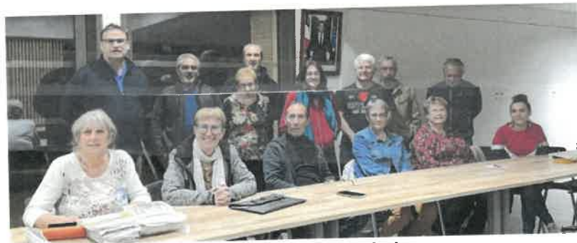
Le groupe Mandrinades brézinois a terminé la maquette du char.

Ce mercredi soir 6 novembre, à la salle de la mairie, s'est tenue une réunion sur les Mandrinades 2025 qui se dérouleront à Saint-Étienne-de-Saint-Geoirs les 12 et 13 juillet. Après dix ans d'attente, de nombreux bénévoles vont renouer avec cette grande fête réputée qui rend hommage au contrebandier Louis Mandrin, un bandit devenu vite populaire.