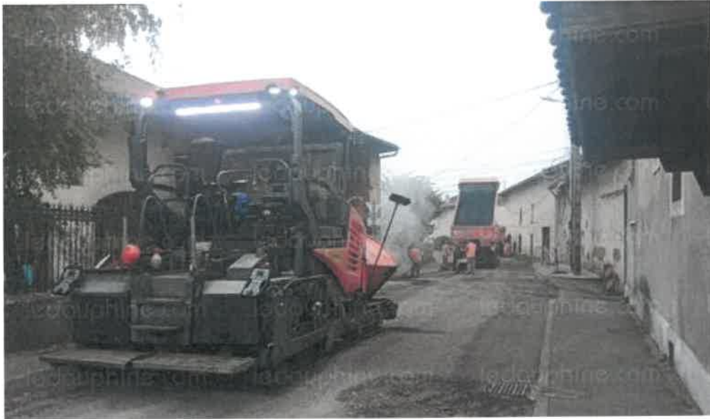
Les engins de chantier ont quitté le quartier ce mercredi.

Les travaux au quartier Champ-Canel viennent de prendre fin. Ils visaient à créer de nouveaux puits afin d'améliorer le ruissellement du surplus d'eau en cas de fortes averses. Des travaux qui ont nécessité l'utilisation d'engins de travaux publics, comme le bulldozer. Les derniers engins sont partis ce mercredi soir 6 novembre, après le marquage signalétique au sol par des bandes blanches. Pour permettre la tenue de ces travaux, le quartier a par moments été fermé à la circulation.