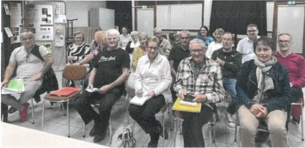
Réunion des diverses associations pour préparer cette journée de solidarité.

Une journée de solidarité pour le Téléthon sera proposée ce samedi 30 novembre à Brézins. Avec au programme, de nombreuses et diverses animations.