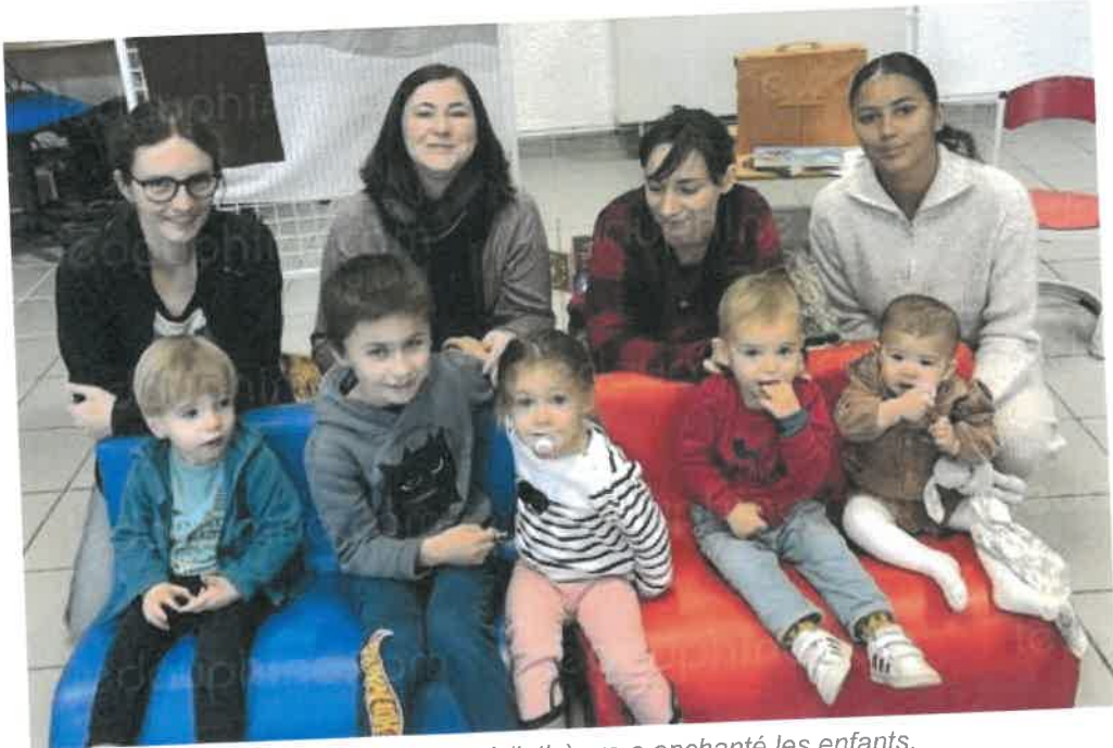
Cette séance à la médiathèque a enchanté les enfants.

Samedi 16 novembre au matin, c'était la séance lecture et histoires de rêve à la bibliothèque. Une histoire de bébés chouettes qui ont perdu leur maman, sur le thème de "La forêt" et le décor qui va avec. Les enfants ont chanté plusieurs comptines et lu plein de livres autour des écureuils, des castors et des autres animaux de la forêt.