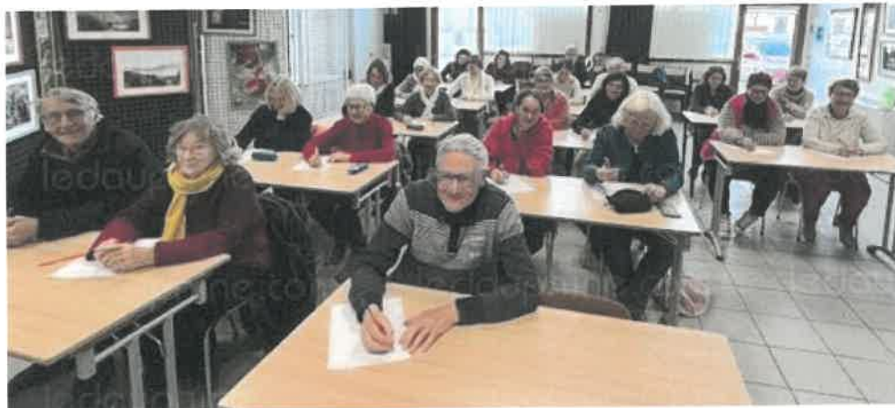
Des adultes studieux pour la dictée d'Elia-Reine.

Vingt-deux parents se sont retrouvés samedi 30 novembre à la salle de la Rencontre pour participer à la dictée proposée par Elia-Reine. La bibliothécaire avait choisi un texte tiré du roman Le Village retrouvé de Marie de Palet. Un texte sublime. Un seul participant n'a fait une seule faute, une faute de trait d'union. Beaucoup de dames mais peu de messieurs étaient présents. Chaque année, de plus en plus de monde vient tester ses connaissances et se remémorer les règles de grammaire parfois enfouies au fond de sa mémoire. L'ambiance était comme sur les bancs de l'école, conviviale et chaleureuse. Les dictées restent anonymes et le plus grand nombre de fautes restera donc secret.