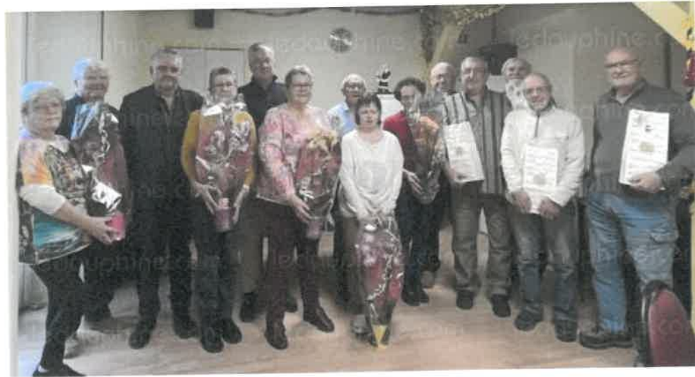
Ils ont fêté leur anniversaire au club des aînés.

Mardi 10 décembre, les adhérents de l'association Génération mouvement du club des aînés se sont déplacés en nombre pour fêter comme il se doit les anniversaires des adhérents dont l'année de naissance se terminait par 4 ou 9.