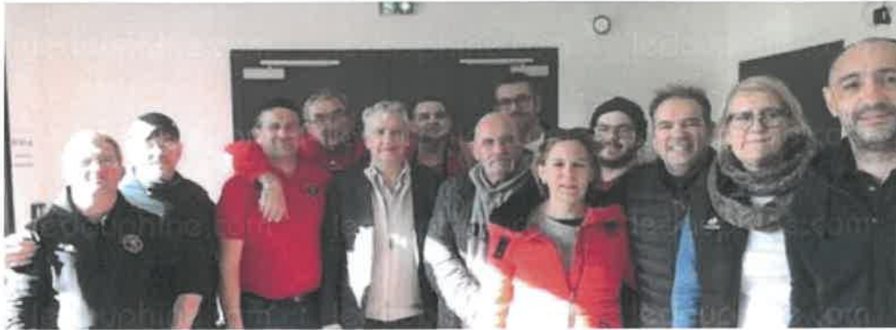
Les rugbymen ont cuisiné 600 diots.

Dimanche matin, les rugbymen ont troqué les crampons et shorts pour devenir de fins cuisiniers. Ils se sont affairés à la cuisson pour que dès 10 heures les premières ventes commencent. 600 diots ont mijoté avec du vin blanc et des petits oignons et tous seront vendus accompagnés de frites. À noter la présence de Jean-Pierre Barbier président du conseil départemental de l'Isère et de Gilles Gelas venus saluer tous ces bénévoles qui ont fait de cette matinée une vraie réussite. Toute la matinée ce n'était qu'un va-et-vient de gourmets ou simplement des amoureux du rugby. La journée s'est poursuivie par un match de rugby féminin : la Côte-Saint-André contre Montélimar remporté par les Côtaises (24 à 17).