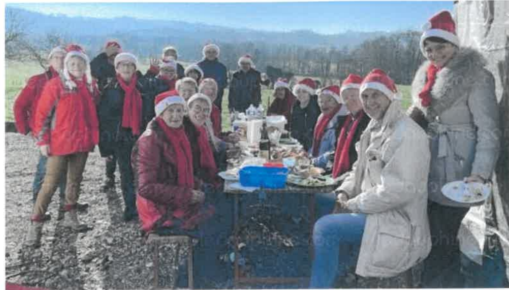
Le groupe des Berzinois lors du marché 2023.

Dimanche 22 décembre à la Ferme des 13 fontaines, de 10 h à 17 h, les producteurs du Viennois au Chambarran organisent un grand marché de Noël. L'événement accueillera des producteurs locaux, avec des légumes de saison, de l'huile de noix, escargots, volaille, miel, foie gras... On trouvera aussi de la bière, du vin et des stands d'artisans, pour préparer les fêtes.