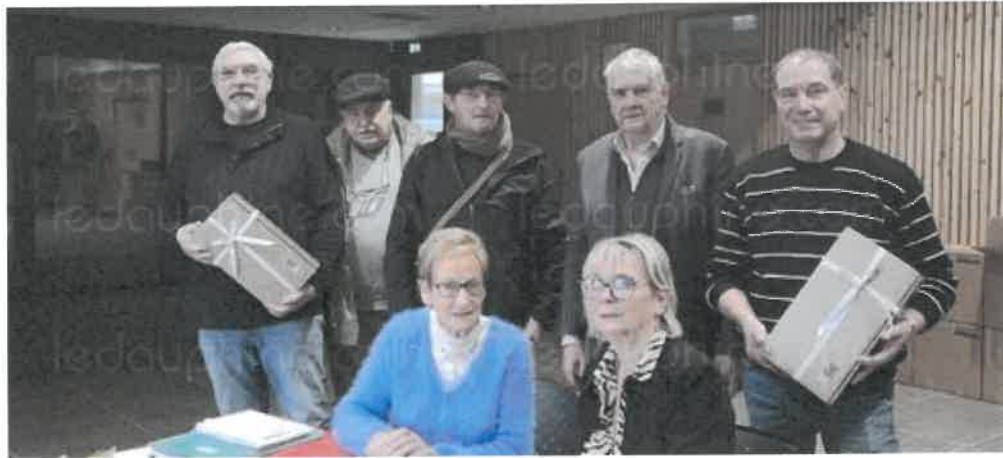
Une organisation parfaite pour la remise des colis.

En fin de semaine dernière, le centre communal d'action social et la municipalité ont remis les colis aux anciens du village qui ne souhaitaient ou ne pouvaient pas se rendre au repas. Ils ont été 140 à venir récupérer leur paquet rempli de gourmandises. En cette période de fête, ce geste envers les aînés est un moment que la commune veut joyeux et chaleureux. C'est aussi un moment de rencontre, d'échange et de partage. Dimanche 15 décembre a eu lieu le repas de Noël des aînés, à la salle du Tremplin, réunissant plus de 180 personnes de plus de 65 ans. Les aînés d'un village sont très importants, ils sont ceux qui peuvent apporter des témoignages sur l'évolution et l'histoire du village.