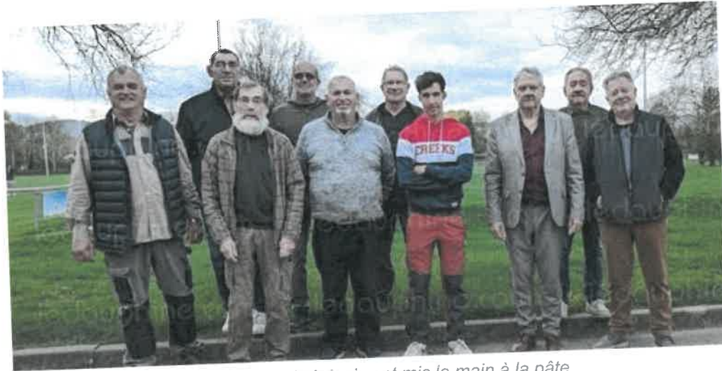
Les chasseurs brézinois ont mis la main à la pâte.