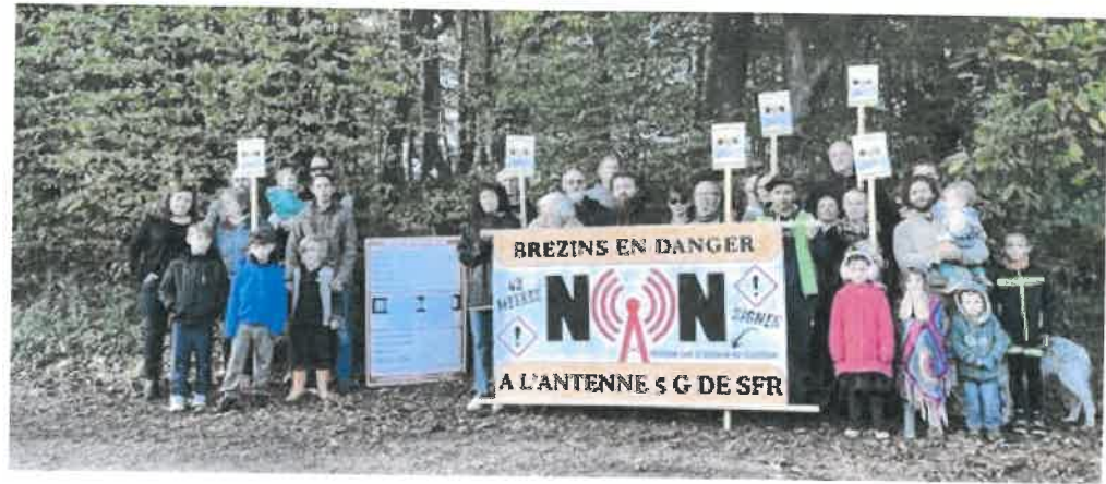
Les riverains ont manifesté leur exaspération.

Alors qu'une antenne 5G doit être installée à Brézins, des riverains manifestent leur forte opposition. Ils ont lancé une pétition qui a récolté plus de 300 signatures.