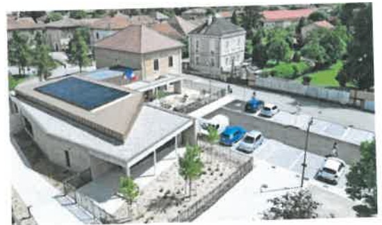
Le toit de la nouvelle mairie a été équipé de panneaux.

Cela s'est traduit entre autres par l'identification dans la commune des sites pouvant accueillir un système d'énergies non fossiles. L'éolienne étant difficile à mettre en place avec la présence de l'aéroport, c'est donc sur le développement de panneaux photovoltaïques que la commune s'est tournée. Cela a été fait avec la mise en place d'ombrières sur le nouveau parking près du stade, en collaboration avec TE38 (Territoire d'énergie) et sa filiale Ombr'isère. D'une surface de 3 500 m 2 , cela représente une puissance de 290 kWc pouvant alimenter une centaine de foyers, la