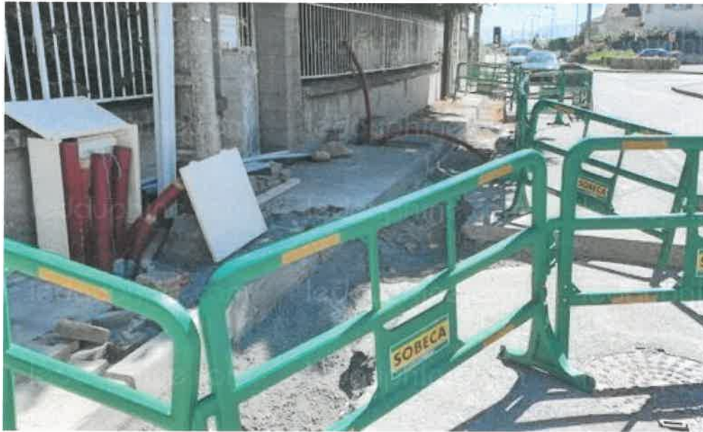
Les travaux d'enfouissement au Grand chemin.

Le Grand-chemin connaît depuis quelque temps des travaux d'enfouissement de réseaux. Cet axe est une artère du village, placé sur la départementale 519, et est très emprunté. De ce fait, les travaux ont des conséquences sur la circulation, qui se retrouve quelque peu perturbée.