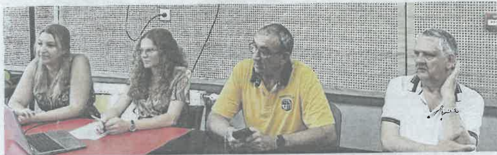
Le Rugby club Brézins fera partie de l'organisation de la fête du 15 août.