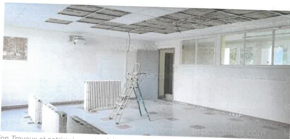
La commission Travaux et patrimoine reste vigilante sur le programme pluriannuel de la rénovation des bâtiments communaux.

Les vacances d'été sont une période de travaux dans les locaux de l'école de la Fraternité. Cette année, deux chantiers sont menés de front : d'abord la tisanerie de l'école maternelle, qui va retrouver une seconde jeunesse. Sont prévus le remplacement d'une crédence, la réalisation d'un rangement et le changement de la cuisinière.