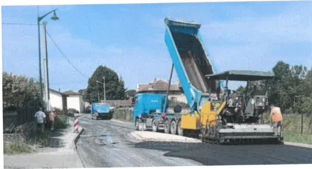
Le chantier, bientôt terminé.

Depuis quelques jours, la circulation sur la D519 est un peu perturbée et depuis le début de la semaine, la route est complètement coupée, afin de réaliser la réfection du revêtement.