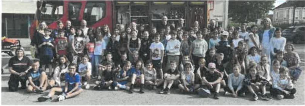
Ce sont 66 élèves qui ont pris part à ces ateliers de découverte, avec les sapeurs-pompiers du centre de secours de Saint-Étienne-de-Saint-Geoirs.

Lundi 1 er juillet, sur la place de l'École, il y avait de l'animation pour les enfants de CE2, CM1 et CM2 ! En effet, trois camions de sapeurs-pompiers, bien différents les uns des autres, attendaient les écoliers pour différents ateliers.