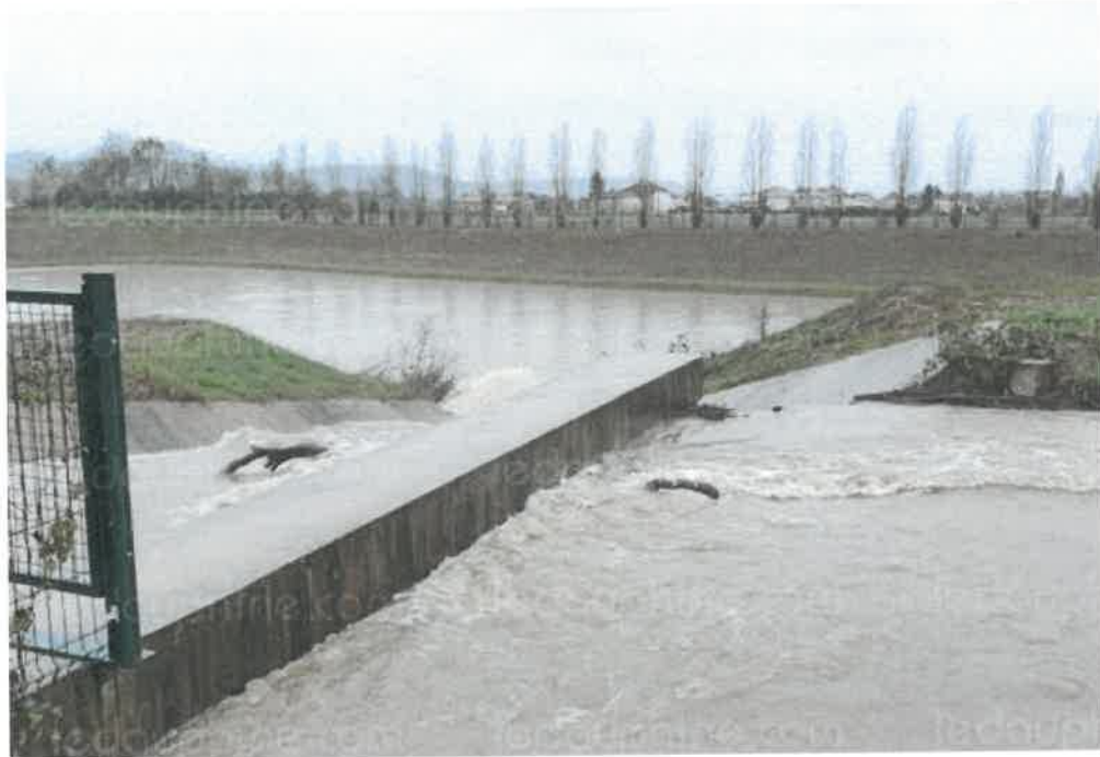
Les deux bacs d'infiltration ont bien fonctionné lors des dernières fortes pluies.

Lors des épisodes climatiques intenses, le Rival, qui traverse la commune, peu déborder dans le village. Après plusieurs épisodes lors du siècle dernier, deux bacs d'infiltration ont été aménagés en 2016. Depuis, ils ont prouvé leur efficacité.