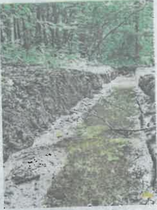
Les engins laissent des ornières de plus de 35 cm de profondeur.

Des promeneurs qui aiment randonner sur les chemins de traverses ou dans les sous-bois de la Bièvre, tout comme ceux qui pratiquent le VTT, n'ont pu que constater ce triste spectacle : des chemins rendus impraticables. En cause, des ornières de 35 cm de profondeur, parfois plus, laissées sur les chemins par des engins motorisés.