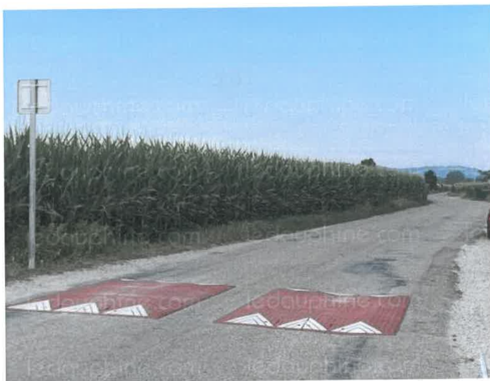
Dans la rue des Sablières.

À chaque fois que la municipalité rencontre les habitants, notamment pendant les réunions de quartier, un même problème est évoqué, la vitesse excessive des automobilistes. Pour répondre à cela, en début de semaine au quartier du Martinet et mercredi rue des Sablières, des coussins berlinois, nommés ainsi car testés pour la première fois à Berlin, ont été posés. Les ralentisseurs classiques prennent toute la largeur de la route, pénalisant les bicyclettes et les véhicules d'urgence. Ce dispositif est destiné à ralentir la vitesse des automobiles sans gêner les autres usagers de la chaussée. Les cyclistes peuvent passer à droite et les bus et véhicules d'urgence par-dessus, sans le toucher avec leurs roues, alors que les voitures doivent obligatoirement le traverser. Les coussins berlinois sont notamment utilisés pour faire respecter les zones 30.