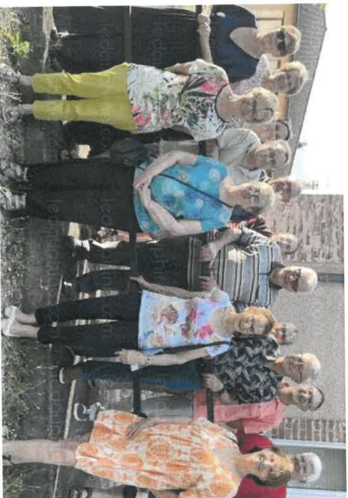
Le comité des fêtes et le RCB misent beaucoup sur le pucier de 250 marchands pour attirer du monde.

La traditionnelle fête du 15-Août sera maintenue grâce à la mobilisation du Rugby club Brézins (RCB). Une réunion s'est tenue mardi 9 juillet avec le comité des fêtes pour organiser l'évènement. Le feu d'artifice, lui, fera enfin son grand retour.