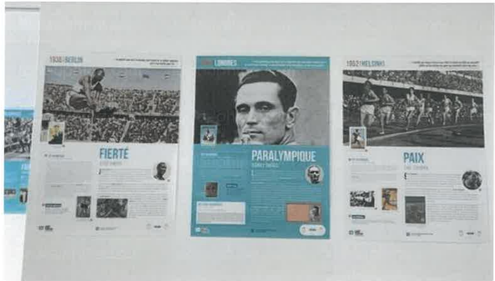
Une exposition très enrichissante.

Alors que les Jeux olympiques battent leur plein, Brézins accueille une exposition qui retrace plus d'un siècle de Jeux, entre exploits sportifs et avancées historiques.