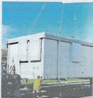
Une page se tourne avec le départ du préfabriqué.

Maintenant que le nouveau bâtiment de la mairie a pris du service, il était temps pour le préfabriqué qui a fait office d'accueil pendant toute la durée du chantier de disparaître du paysage. Une page s'est définitivement tournée à Brézins. Après 18 mois de présence entre la cantine et la salle de la Rencontre, il laisse place au bâtiment neuf.