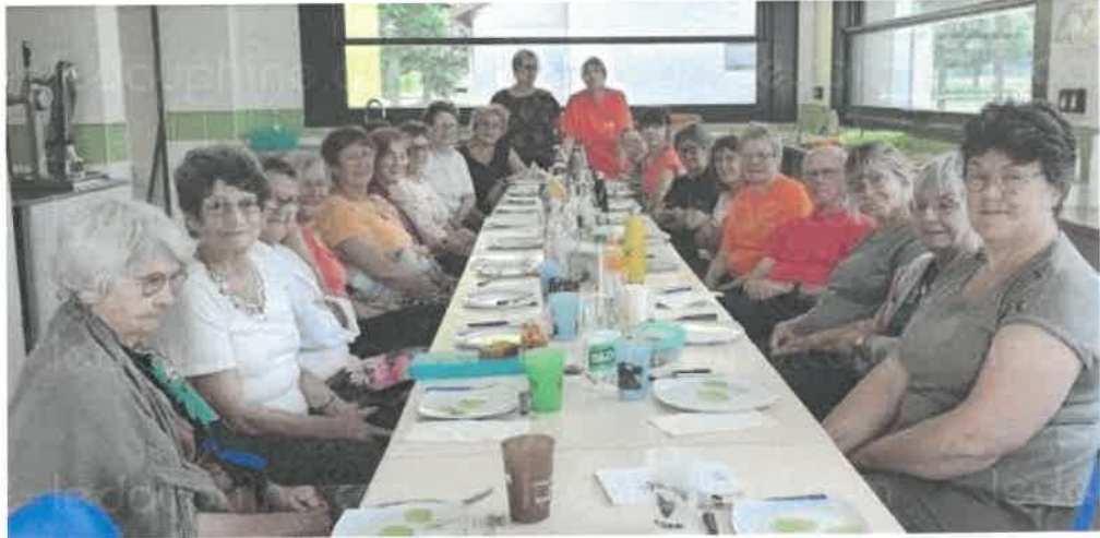
Pendant et après l'assemblée générale, tout le monde a festoyé dans la bonne humeur.

Mercredi 3 juillet à midi, au gymnase La Gutine, se déroulait l'assemblée générale de la Gymnastique volontaire. Et, fait original, c'est autour d'un repas que le bureau et les adhérents se sont retrouvés pour faire le point.