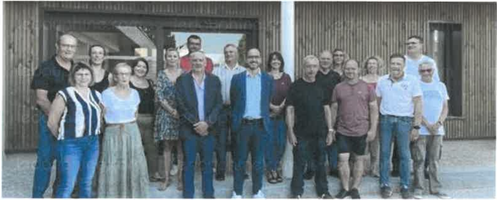
Les élus ont voulu immortaliser ce moment.

Le dernier conseil municipal avant les vacances était aussi le premier dans la nouvelle mairie. École et travaux étaient au menu des élus.