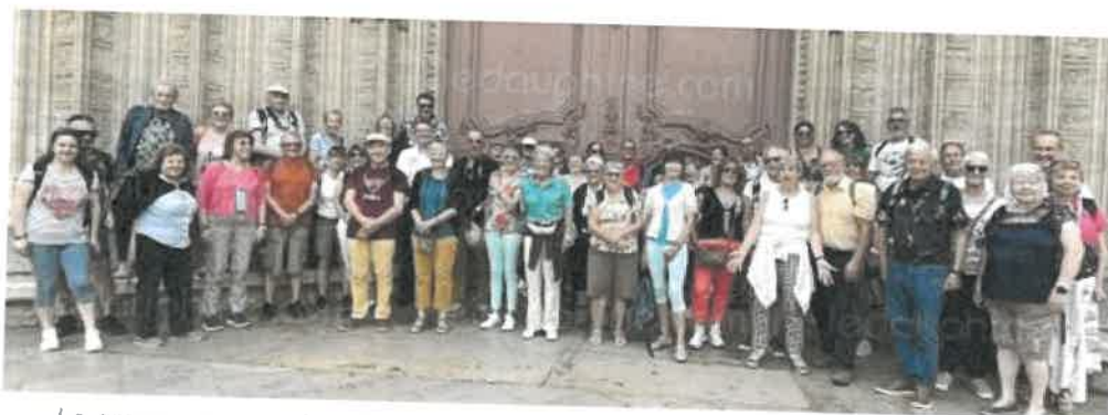
Le groupe au complet, devant la cathédrale Saint-Jean, au cœur du vieux Lyon.